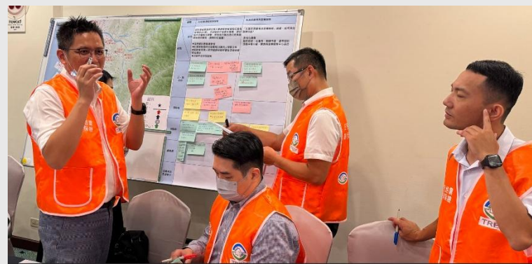
臺中區災區聯合理賠服務中心