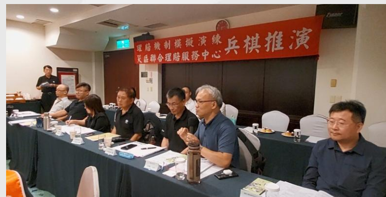
兵棋推演評核官綜合講評