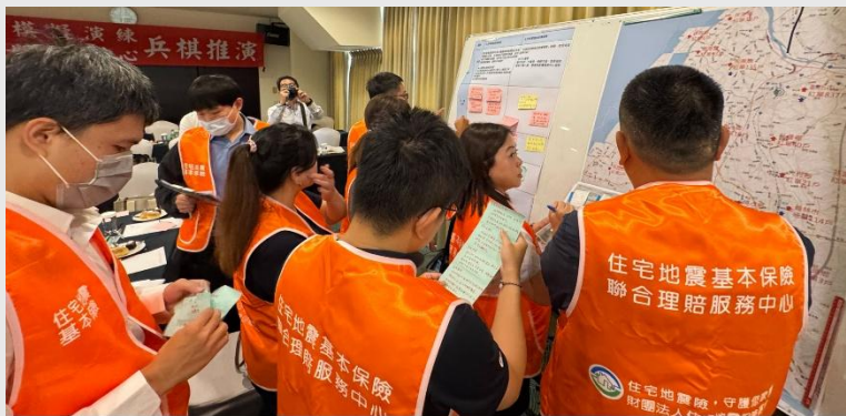
彰化區災區聯合理賠服務中心