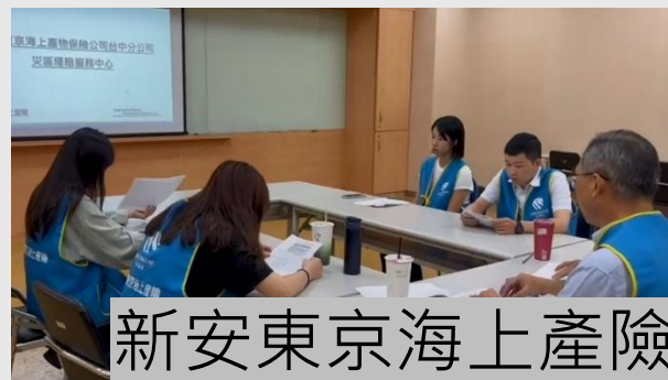
新安東京海上產險