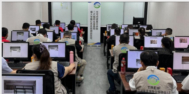
進行災損建築物評定